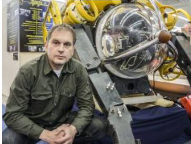
SAJAM NAUTIKE: Podmornica James Bonda traži sponzore za obnovu