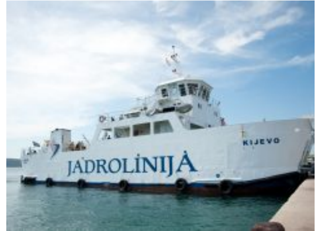
Pokvarilo se "Kijevo" – Veza Tkona i kopna ovisna o dobroj volji Jadrolinije?