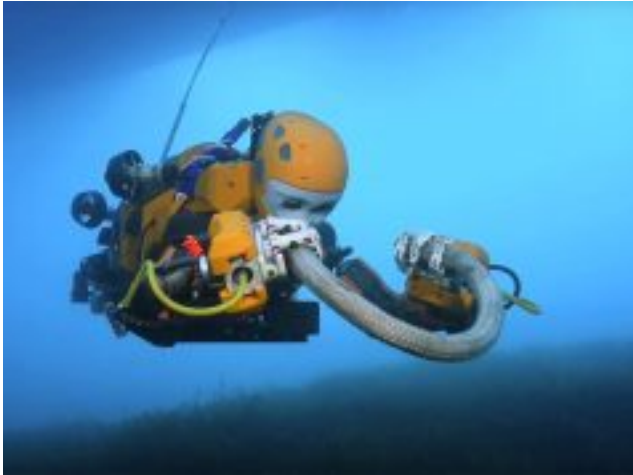
Konferencija o pomorskoj robotici: Sve o automatici na brodovima u Opatiji