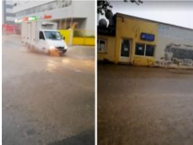
Nevrijeme u Zadru i Biogradu opet poplavilo prometnice